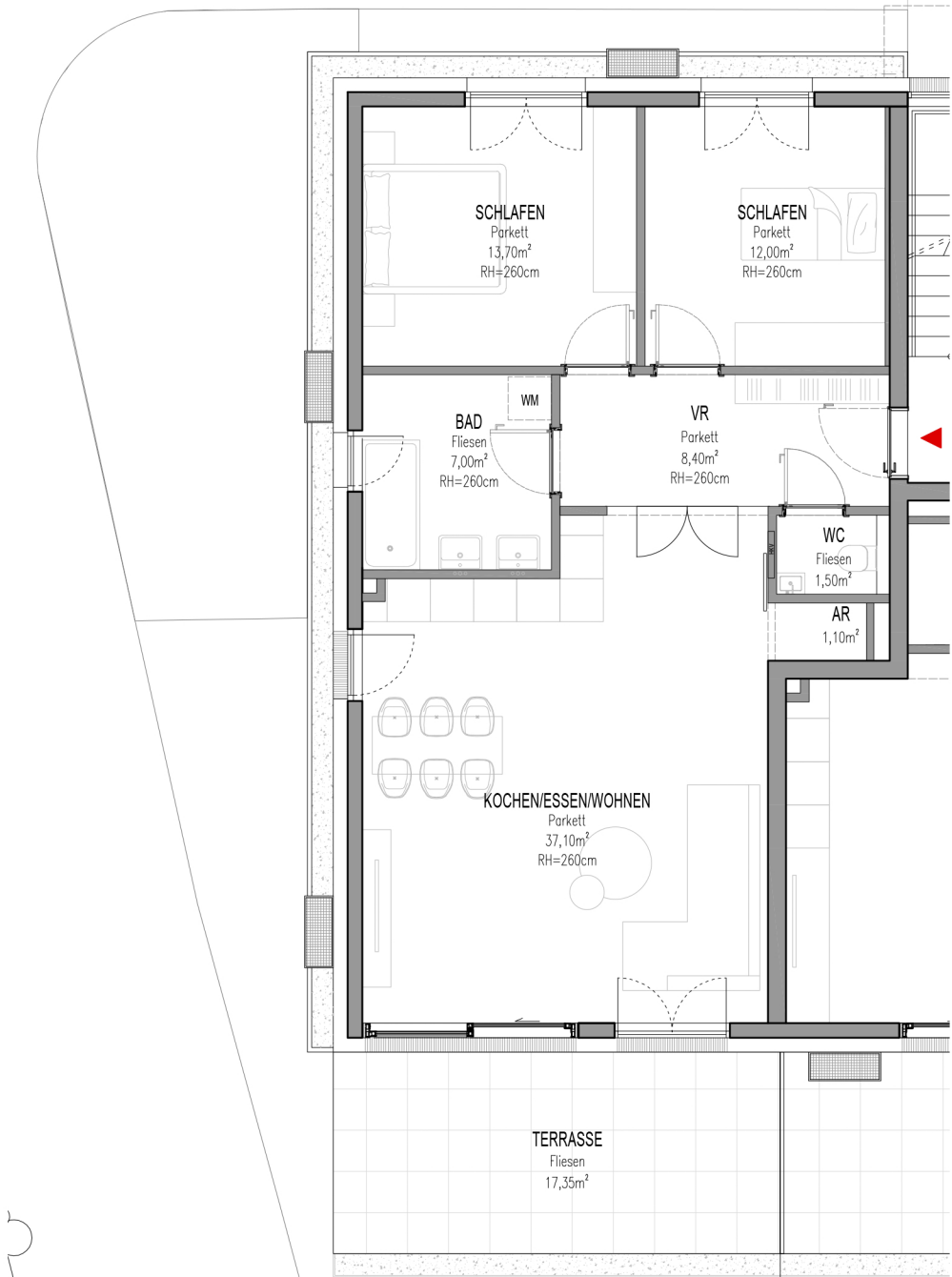
TOP 03 - ERDGESCHOSS